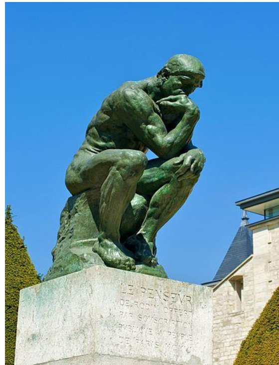
Paris 2010- Le penseur

Vgl. EuGH (Plenum), Gutachten 1/09 v. 8. März 2011 (eigenes Patentgerichtssystem unzulässig) Rn. 80.